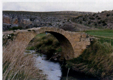
Puente de San Felices

Pocos metros más abajo se aprecia restos de otro puente muy antiguo, que por las características se aceptaría más a una alcantarilla, pero no se reconocen los sumideros; aunque también se puede admitir, por la configuración del terreno, que pudo ir el camino Ágreda a San Felices.