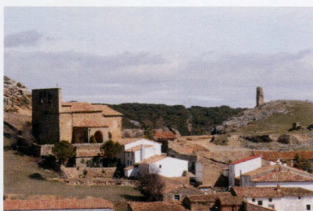
Añavieja, al fondo los restos de la atalaya.

la Callejuela. Fecha: XIII días de febrero».