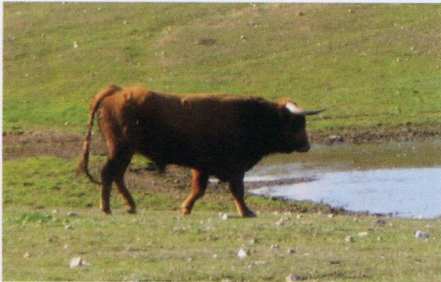
Rojizo toro de Carriquirri

«... La otra mitad debería abonarlas antes del 1 de mayo de 1909, descontadas 12.500 pesetas por las hierbas que pastaba el ganado bravo en los sotos de Murillo de Las Limas, Berbinzana y laguna de Añavieja». Continúa la escritura con otros datos que no vienen a cuento.