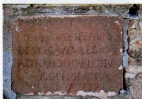
Datación del Pósito Real