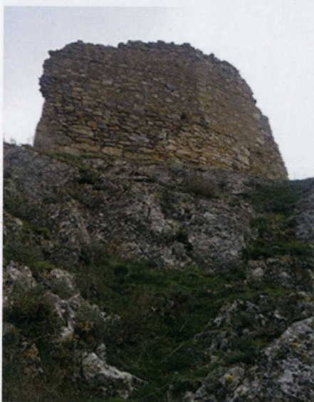
Ruinas de la atalaya de Añavieja

La dificultad de repoblación cristiana de estas tierras fue problemática, al estar en la extremadura histórica; no eran muy apetecibles,