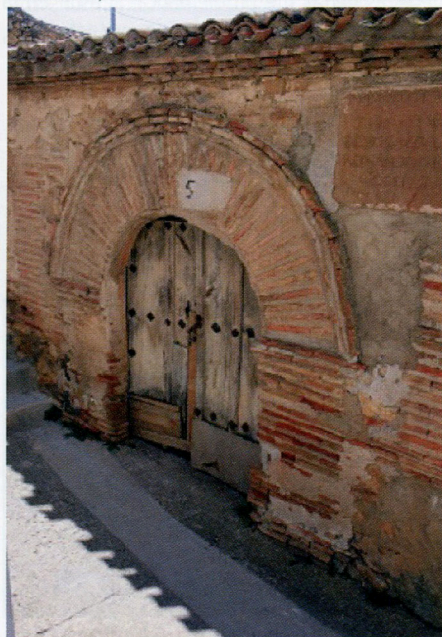
Portada del Pósito Real.