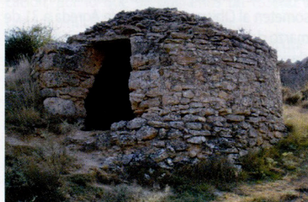
Nevera de Añavieja

Entre los edificios civiles es interesante su "nevera", recientemente restaurada. La nevera es redondeada; siendo su circunferencia de 20 m. de longitud y sus paredes oscilan alrededor de los 60 cm. de grosor, por lo que deducimos que el radio interno es prácticamente de 2'50 m.