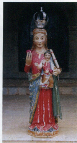
Virgen de Sopena

Su iglesia, románica de transición entre finales del XII y primer tercio del siglo XIII, presenta su portada de sencillas arquivoltas románicas, la típica espadaña románica por torre y adosado un pórtico de 1.714. Se observa elevaciones posteriores de su techumbre varias veces. Una imagen gótica rural del siglo XIV de la Virgen de Sopena, que rompe esculturalmente la concepción clásica de la época al estar la Virgen de pie y con el Niño a su izquierda, siendo característico el mostrar sendas manzanas ambos; también es digno de reseñar un Cristo antiguo de dudosa catalogación. El resto de la fábrica se aprecia la piedra a simple vista y el ábside románico de piedra de sillería en su interior queda tapado por un retablo barroco de buena factura, siendo a mi parecer donación de un hijo del pueblo Juan Ruiz Simón que fue obispo de Canarias a principios del siglo XVIII. Debajo del coro, un baptisterio interesante, guarda las mencionadas aras pacis romanas y un pila bautismal románica, donada por la iglesia del pueblo de Nieva, registrada en el trabajo realizado por Francisco José García Gómez titulado "Pilas Bautismales Románicas en la provincia de Soria" (Celtiberia, no 101, año 2007). La iglesia parroquial está bajo la advocación de Santa Engracia, que se recuerda cada 16 de abril con el nombre de la Fiesta Pequeña; en dicha festividad se encendía una gran hoguera pública, que tradicionalmente se sigue cumpliendo.